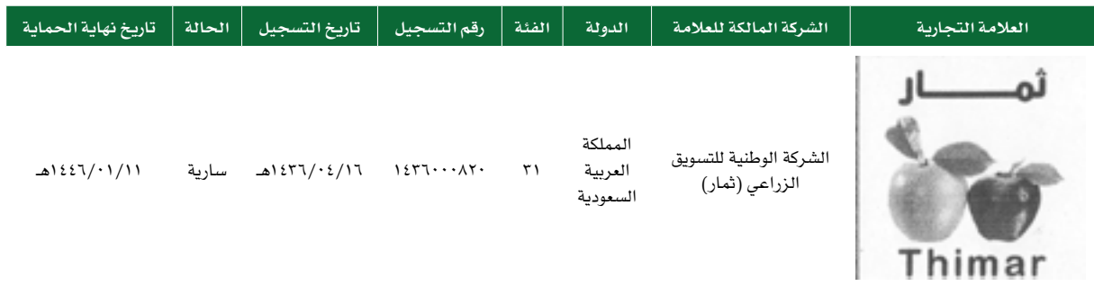
الجدول رقم (٧): العلامات التجارية

تعتمد الشركة في تسويق خدماتها على علامتها التجارية، والتي تدعم أعمالها ومركزها التنافسي، وتمنحها تميزاً واضحاً في السوق بين العملاء، قامت الشركة بتسجيل علامتها التجارية لدى وزارة التجارة والصناعة وفقاً للجدول أدناه: