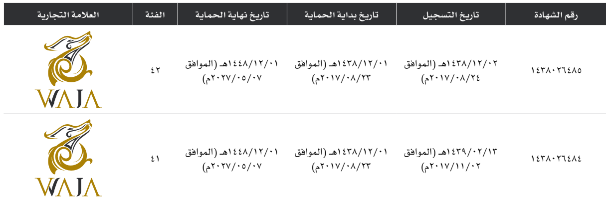
الجدول رقم (٣٧): العلامات التجارية المسجلة